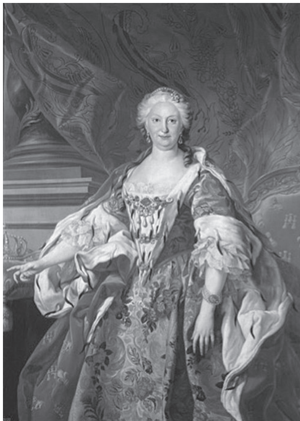
Figura 4. La reina Isabel de Farnesio Michel van Loo (c.1739) Museo del Prado