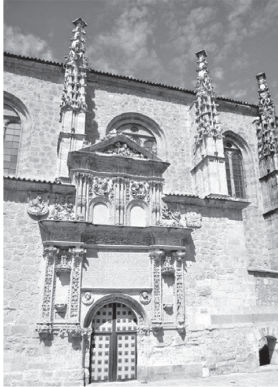
Portada de la Iglesia de Sancti Spiritus. Salamanca.

Aprobó el monarca la realización de esta visita extraordinaria y nombró a los visitadores generales, quienes la efectuaron y en su informe de visita confirmaron que, en efecto, algunas religiosas y sus criadas habían tenido hijos de paternidad desconocida, se realizaban en el convento todo tipo de actos que nada tenían que ver con la clausura que debían observar y que, finalmente, la antigüedad de la fábrica del monasterio y las malas condiciones de habitabilidad aconsejaban su demolición y la edificación de un nuevo convento. El Consejo, que ya conocía la inutilidad que producían en la comunidad sus mandatos y disposiciones, y convencido que esto último, es decir, abandono del convento por las religiosas y realización de un nuevo edificio, podría ser una solución definitiva a todos los otros males confirmados por los visitadores, así lo propuso al rey, quien con fecha 15 de marzo de 1786 ordenó hacer un monasterio de nueva planta conservándose la iglesia que era obra posterior, teniendo las monjas que desalojar el convento y trasladarse a otro a su elección, como así lo hicieron en el mes de julio de dicho año 1786.