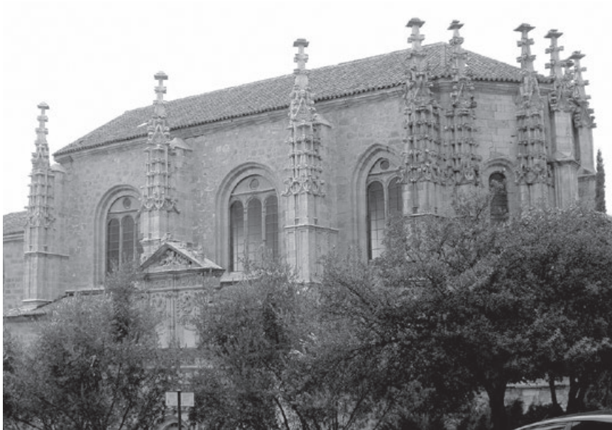
Iglesia de Sancti Spiritus. Salamanca