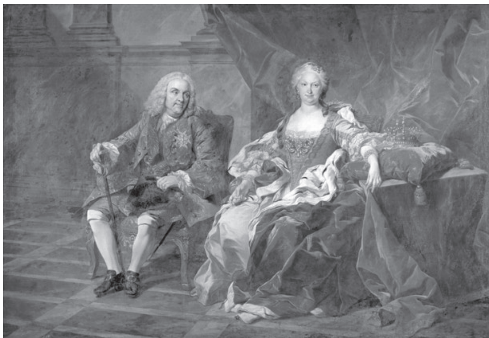
Figura 5 . Felipe V de España e Isabel de Farnesio, reyes de España Louis Michel van Loo (1743) Museo del Prado