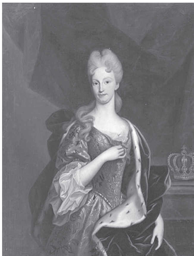
Figura 2. Isabel Farnesio, reina de España Giovani Maria delle Piane (c. 1715) Museo del Prado