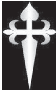
Cruz de la Orden de Santiago