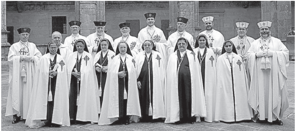
Monjas de la Orden de Santiago con el Presidente del Real Consejo de las Órdenes Militares

Y entramos así en el siglo XVII con esta postura de oposición tan radical de las monjas del monasterio, que el Consejo de las Órdenes no se atrevió, por el momento, a contradecir, dejando sin alterar las profesiones que se hacían en el mismo «según los establecimientos antiguos desta casa y como profesaron las antiguas desta casa», hasta que en el año 1621 envió al convento dos provisiones para profesar dos novicias según disponía la Orden de Santiago y el Concilio de Trento, que tuvo como consecuencia que ni las novicias quisieron profesar ni el administrador quiso dar la profesión de forma distinta a lo ordenado por el Consejo. Alegaban también las monjas que, si se imponía ahora la obligación de clausura en las nuevas profesas, habría entonces en el mismo monasterio unas religiosas con obligación de clausura y otras sin ella, lo que resultaría un gran inconveniente para la convivencia en comunidad, no se producirían más profesiones y llegarían a extinguirse estos monasterios de monjas de Santiago.