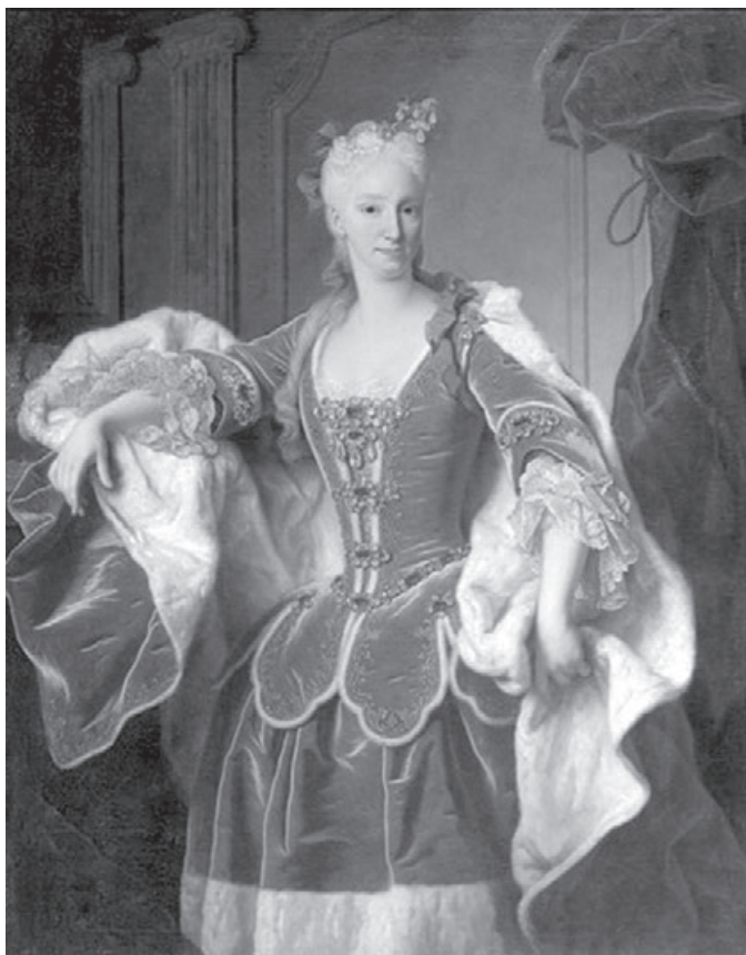
Figura 3 . Isabel Farnesio, reina de España Jean Ranc (1723) Museo del Prado