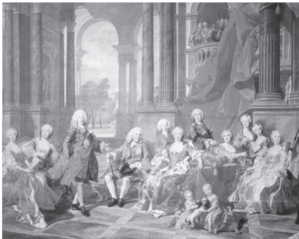
Figura 6 . La familia de Felipe V Louis Michel van Loo (1743) Museo del Prado